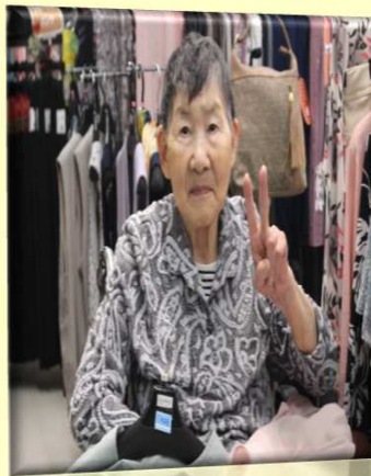
♪ 久しぶりの個別外出 ♪