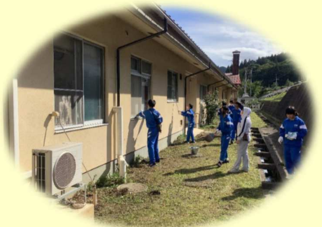
毎年恒例の大川目中学校生徒によるボランティア 「暑い中、がんばったね♪」 すごくきれいになりました。