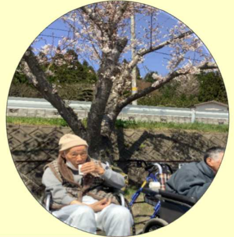
桜の木の下で「特別な物」を飲んでます♪。