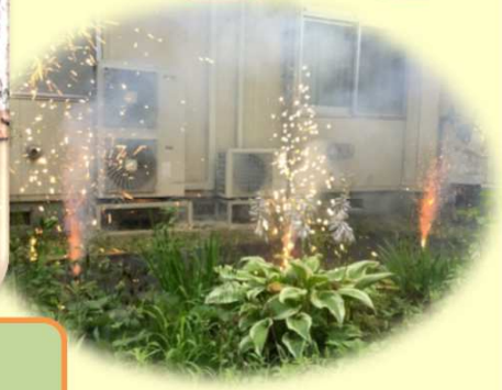
今年は花火大会も行 いました。