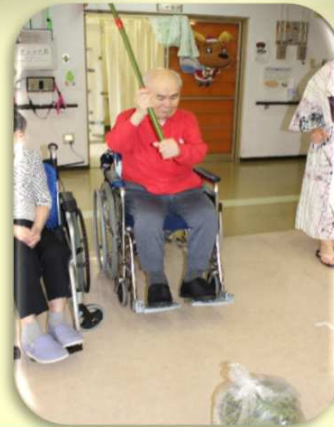
頑張れー!! 「エイ」 スイカは上手く割れたか