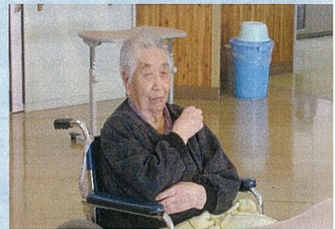
肩たたきをしたり…